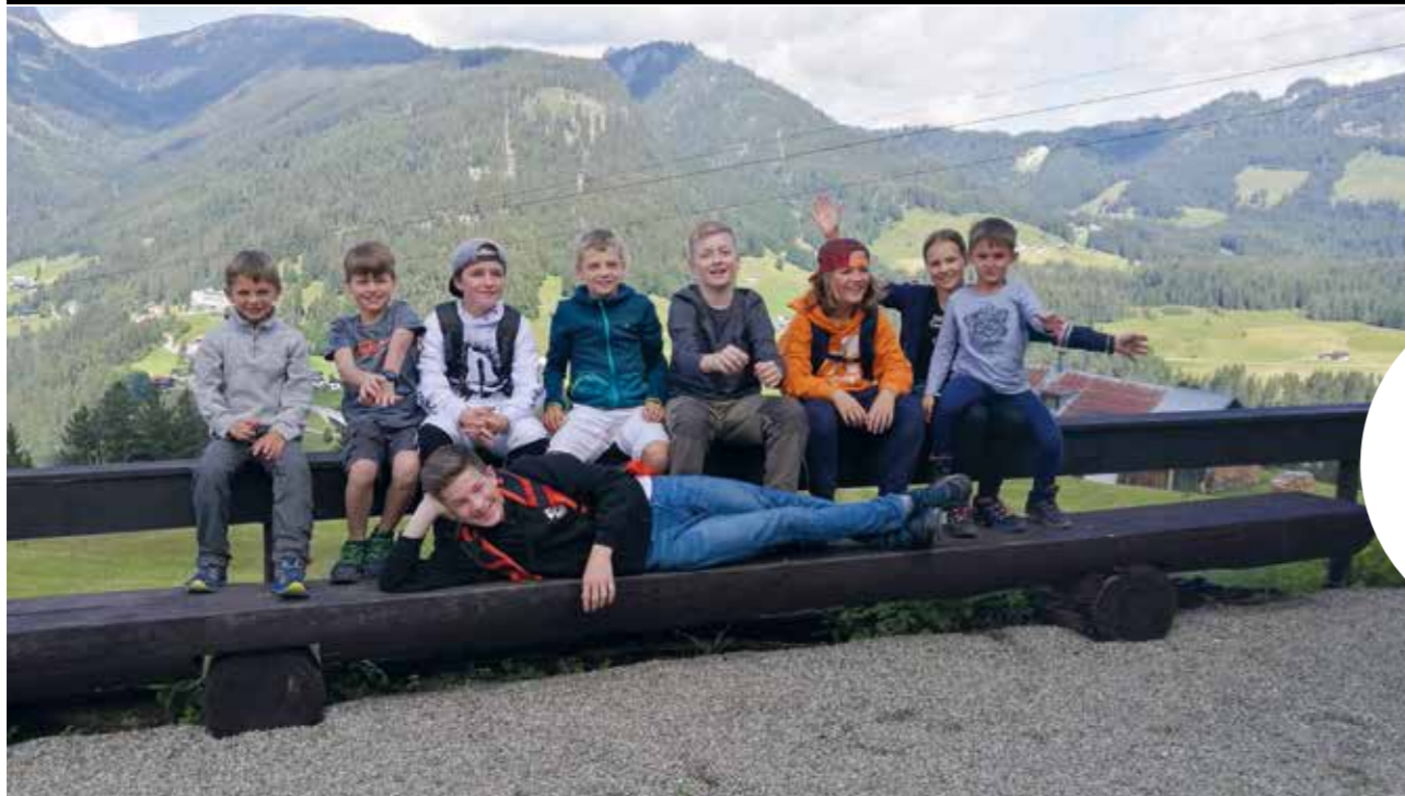
Wanderwochenende im Kleinwalsertal